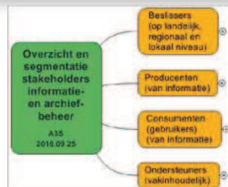
Figuur 2: compacte versie stakeholdermodel.

Burgers en de business zijn stakeholders. Dat sluit goed aan bij het 'environment'-model in het OAS, de ISO-standaard voor het opzetten van een e-depot, met in dat model 'producers' en 'consumers'. 1 Figuur 1 toont dat model, dat vervolgens is uitgewerkt tot een mindmap met daarin alle stakeholders van archivering. De compacte versie daarvan toont figuur 2.